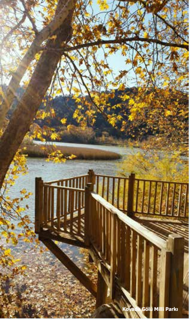
Kovada Gölü Milli Parkı