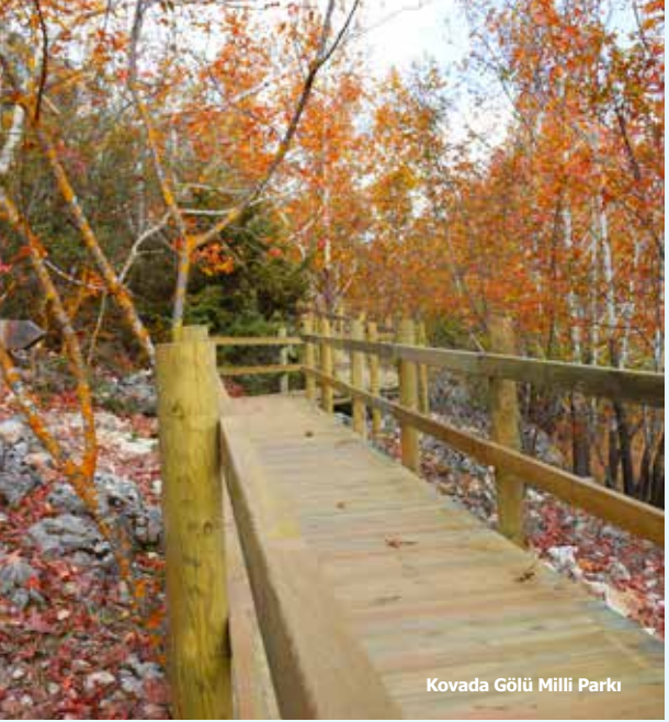
Kovada Gölü Milli Parkı