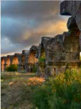
Antiocheia Antik Kenti