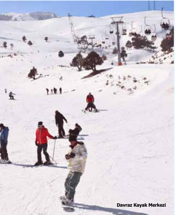
Davraz Kayak Merkezi