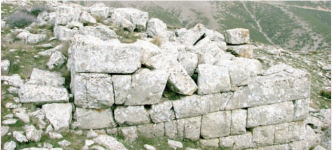
* Conana Antik Kenti

Gönen İlçesinin doğusunda yer alan antik kent, 1879 yılında tespit edilmiştir. Şehirde MÖ I. yüzyıldan itibaren sikke basıldığı bilinir. İmparatorluk sikkelerinin basımı İmparator Hadrianus'dan (MS 117-138) Gallienus (MS 260-268) dönemine kadar sürer. Arazide fazla bir kalıntı görülmez. İlçe sınırları içinden çıkan mimari parçalar ve bol miktardaki mezar stelleri Isparta Müzesi'ne nakledilmiştir.