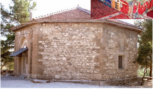
* Sinan Dede Türbesi

Gümüşgün Köyü'nde bulunan sekizgen planlı türbe, içten tavanı kontrplak kaplı, dıştan kırma çatıdır. Çatısının üzeri Marsilya tipi kiremitle kaplıdır. Türbenin giriş kısmında taç kapı, sivri kemerli ve kenarlar dışbükey silmelidir. Türbe sekizgen planlı blok taş platform üzerinde inşa edilmiştir. Dört kenarda, altta dikdörtgen üstte daha küçük aydınlık pencereleri vardır. Alttaki bazı pencereler sonradan iptal edilerek pencere boşlukları kapatılmıştır.