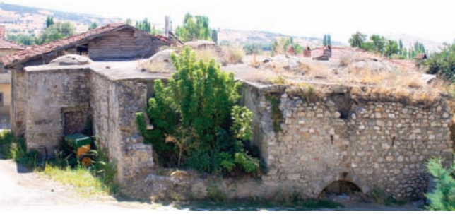
* Eski Hamam