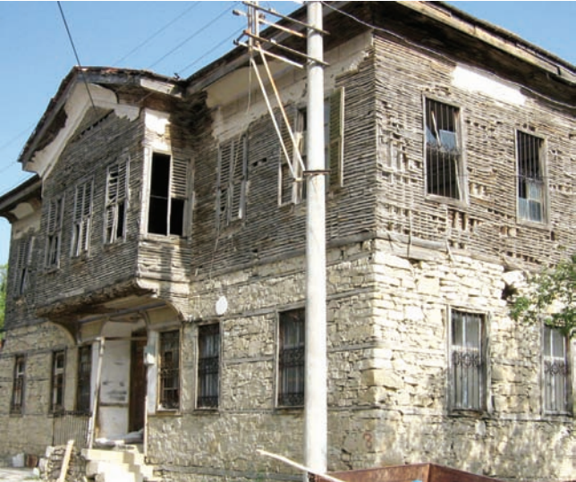
* Demirci Mehmet Efe Konağı

İğdecik Köyü'nde bulunan konak 19. yüzyıl sivil mimari örneklerindedir. Yarı bodrumlu, zemin üzeri bir katlıdır.