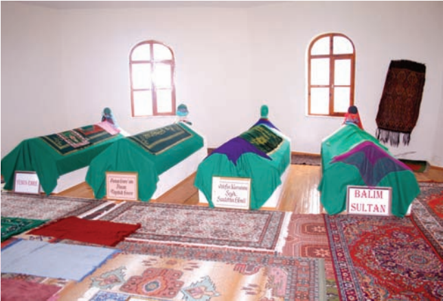
* Yunus Emre Türbesi